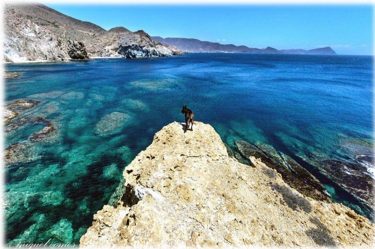
Caminant per Cabo de Gata