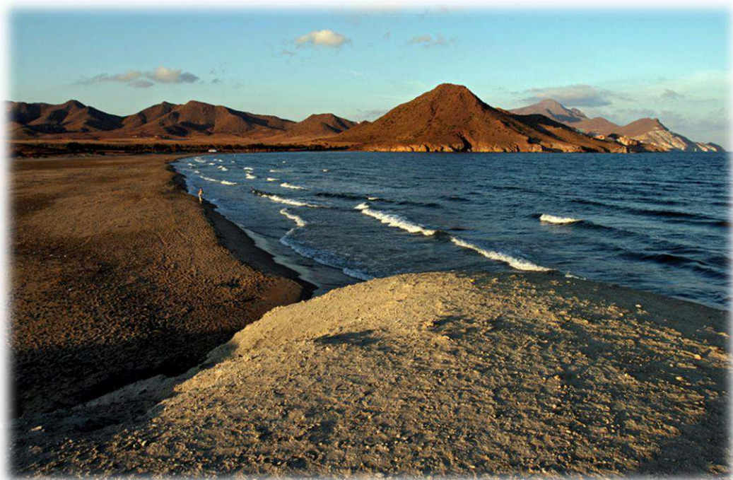
Caminant per Cabo de Gata