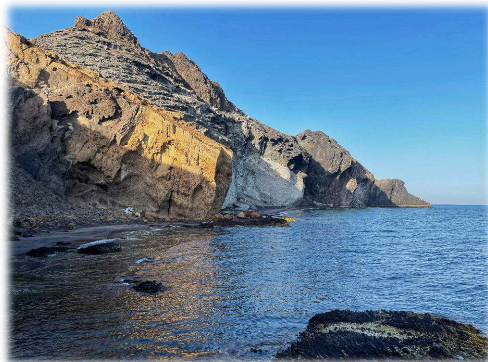
Caminant per Cabo de Gata