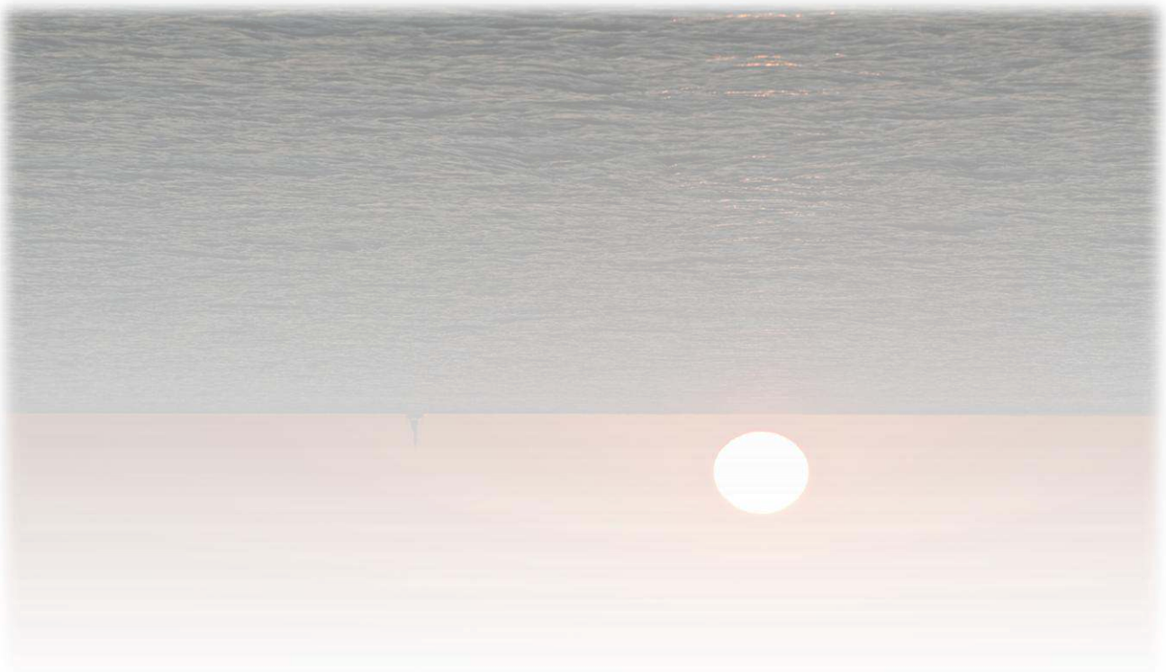
Caminant per Cabo de Gata