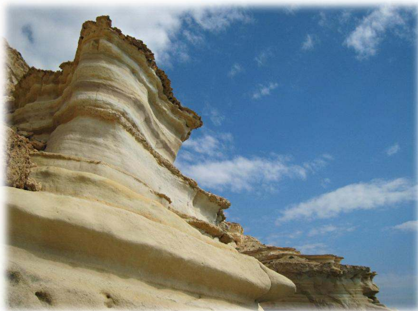
Caminant per Cabo de Gata